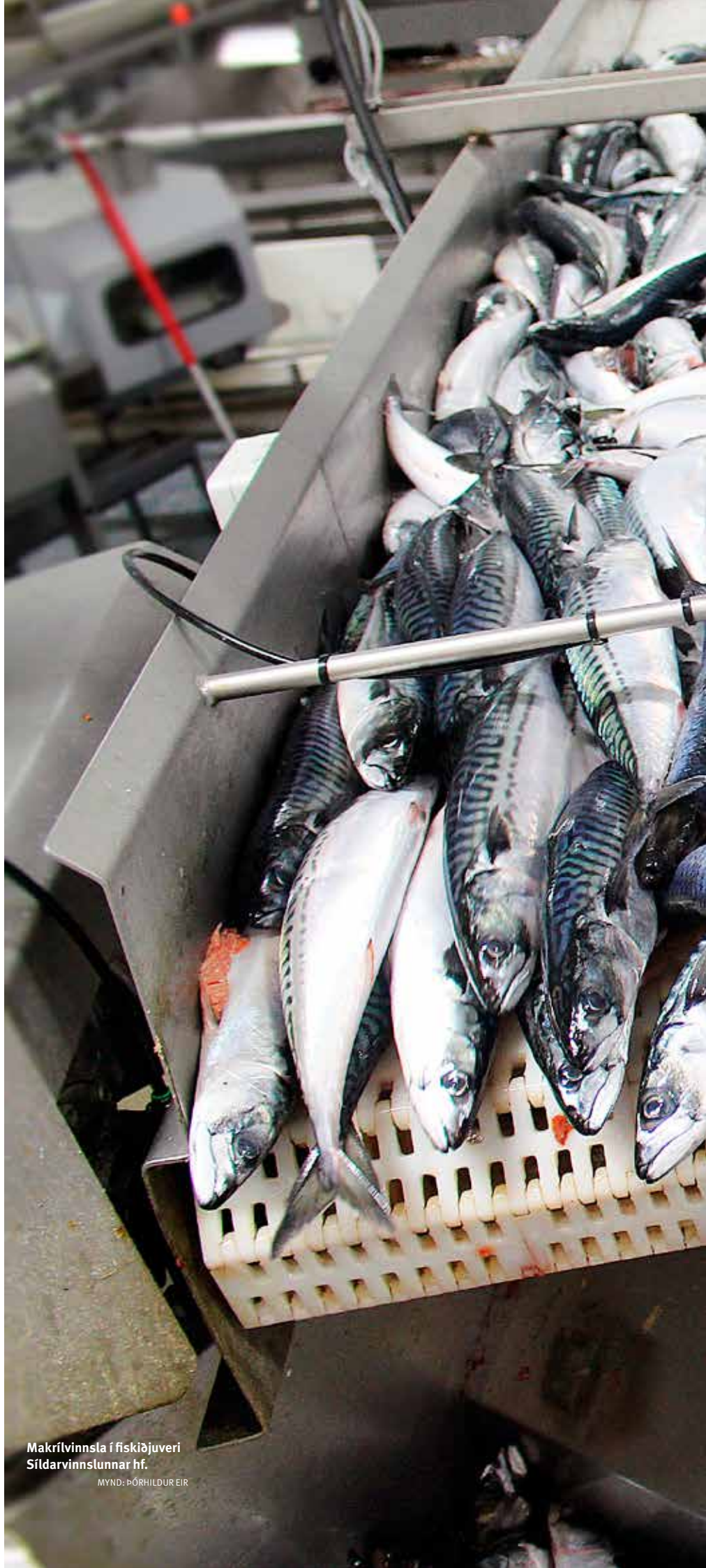
Makrílvinnsla í fiskiðjuveri Síldarvinnslunnar hf.

Þegar makrílveiðar við landið hófust árið 2006 hafði makrils ekki orðið vart í miklum mæli á Íslandsmiðum um áratuga skeið. Heimildir benda hins vegar með ótvíræðum hætti til þess að á hlýskeyðum fyrri ára í sjónum við Ísland hafi makrill gert sig heimakominn við Íslandsstrendur. Á síðasta tug 19. aldar varð vart við makríl úti fyrir Vestur- og Norðurlandi og sumarið 1904 virðist hafa verið allmikið um makríl hér við land og varð hans vart allt frá Hrútafirði til Glettinganess. Eins bárust fréttir af makríl