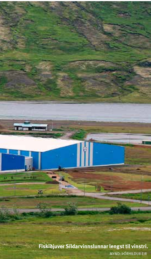
Fiskiðjuver Síldarvinnslunnar lengst til vinstri.